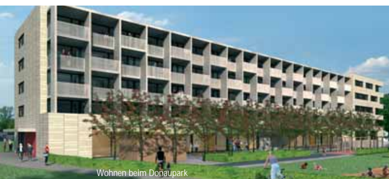
Wohnen beim Donaupark

Als größtes gemeinnütziges Wohnbauunternehmen Oberösterreichs ist sich die GWG Linz ihrer besonderen Verantwortung bewusst. So ging sie als klarer Sieger im Energie-Ranking des Landes Oberösterreich hervor und leistet mit einer dynamischen Wohnbau-Offensive einen wichtigen Beitrag gegen die Wirtschaftskrise.