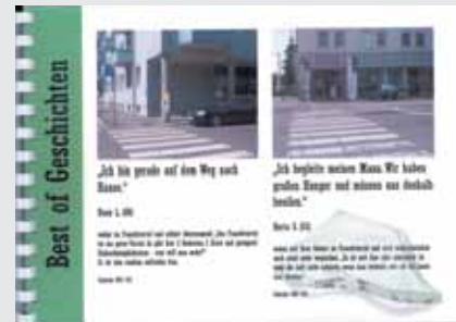
Auszug aus den Alltagsgeschichten

Eine Visualisierung von Alltagskultur. Plakate mit Interviews werden da ausgehängt, wo der Alltag stattfindet, z. B. „Auf dem Weg zum Bus“. Alltagsscherben im kulturellen Ausnahmezustand des Kulturhauptstadtjahres gesammelt durch SchülerInnen der HBLA für künstlerische Gestaltung.