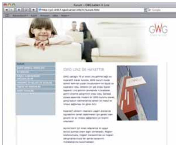
Hier finden Sie alle übersetzten Rubriken übersichtlich und einfach!

Positive Integration bedeutet auf MigrantInnen zugehen. Die GWG hat diesbezügliche kommunikative Maßnahmen bereits in den vergangenen Jahren bewiesen. Es gibt seit vielen Jahren übersetzte Mietvertragsbestimmungen auf Englisch, Serbokroatisch und Türkisch und im Vorjahr wurde die mehrsprachigen Infoboards eingeführt. Um diesen Weg konsequent weiterzugehen, wurde auf der GWG-Website ein integriertes Fremdsprachenservice installiert. Hier können BesucherInnen auch zwischen den Sprachen Englisch, Serbokroatisch und Türkisch wählen.