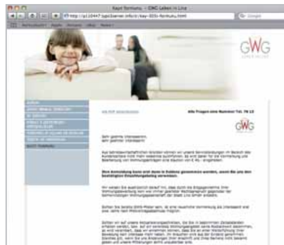
Im Bereich Anmeldeformular können sie dieses als PDF in Deutsch downloaden. Für die Übersetzung klicken Sie bitte einfach auf den deutschen Text und dieser wird in die jeweilige Sprache übersetzt.