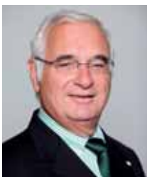
Dir. Hermann Friedl

Die internationale Immobilienkrise hat gezeigt, wie anfällig rein privatwirtschaftliche, auf Spekulation ausgerichtete Wohnbausysteme sind. Untersuchungen beweisen, dass in Ländern mit einem hohen Anteil an frei finanziertem Wohnbau die Gefahr des Entstehens von Spekulationsblasen mit nachfolgenden krisenhaften Systemzusammenbrüchen besonders groß ist. Die direkten Auswirkungen auf die Menschen sind fatal. Viele fallen in die Verschuldung, manche müssen ihr Heim verlassen.