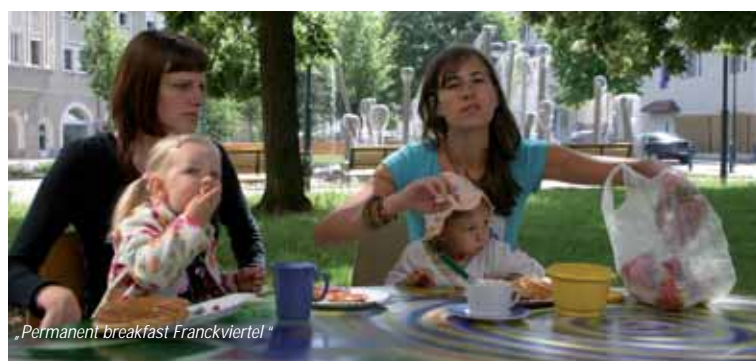
„Permanent breakfast Franckviertel“