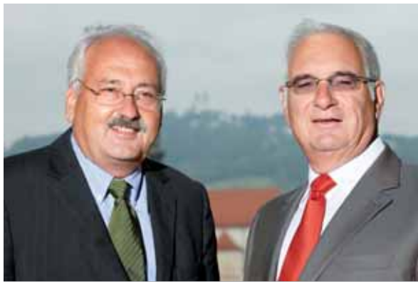
Dir. Hans-Jörg Huber