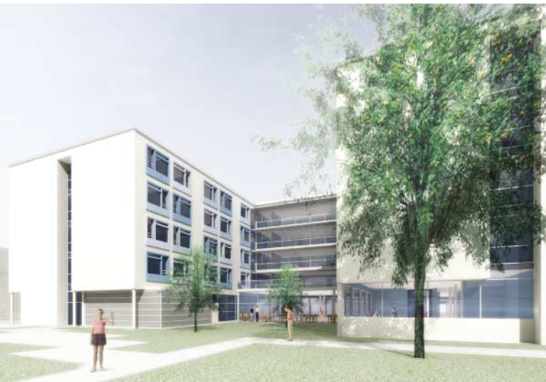
Das neue Seniorenzentrum Hillinger

Mit einem ambitionierten Programm geht die GWG ins Jahr 2006. Neben zahlreichen Wohnbauprojekten wird auch mit dem neuen Seniorenzentrum Hillinger in Linz-Urfahr begonnen.