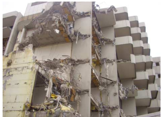
Abbruch des Altbaus

Noch mehr Action als ein Neubau verspricht ein Abbruch: Noch dazu, wenn er innerhalb von nur 40 Tagen vollendet wird, wie derzeit beim Seniorenzentrum Hillinger in Linz-Urfahr. Bei diesem Groß-Vorhaben live dabei zu sein, ist schon etwas ganz Besonderes. Ab Jänner 2006 wird von der GWG ein kompletter Neubau in Angriff genommen. Insgesamt 136 BewohnerInnen werden nach der Fertigstellung im Frühjahr 2008 im neuen fünfgeschossigen Seniorenzentrum Platz finden, das den hohen Ausstattungs- und Qualitätsvorgaben der Heimverordnung des Landes Oberösterreich entsprechen wird.