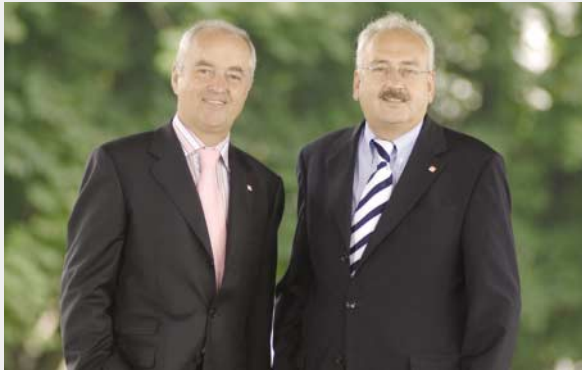
Dir. Werner Scherde