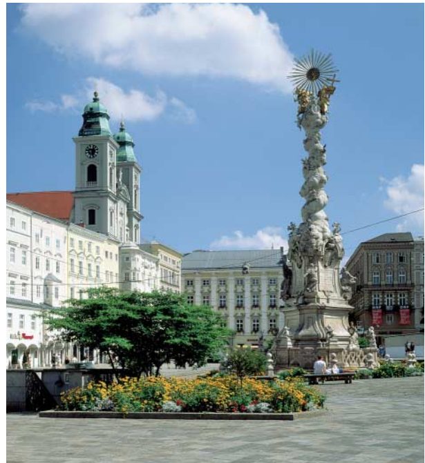
In Linz lässt sich's schön wohnen

Benannt 1947 nach dem Entdecker des Kindbettfiebers und Begründers der Antiseptik Ignaz Philipp Semmelweis (1818-1865).