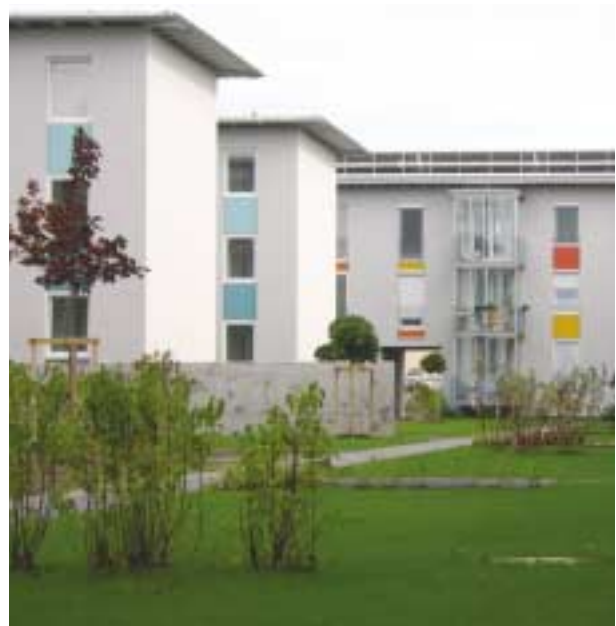
Zweite Bauetappe Dr.-Ernst-Koref-Wohnanlage

Fünf Gebäude aus dem Altbestand bleiben erhalten, als Zeitzeugnis für Arbeiterwohnstätten von früher. Für vier Gebäude wurde bereits Verwendung gefunden: Zwei Häuser dienen als Eltern-Kind-Zentrum für die Stadt Linz, zwei weitere als Krabbelstube. Derzeit werden die Häuser adaptiert und nach deren Fertigstellung Anfang 2006 werden die bestehenden Einrichtungen von der Anastasius-Grün-Straße hierher übersiedeln. In Abstimmung mit dem Denkmalschutz werden je zwei Gebäude mit Glasanbauten verbunden, um eine funktionelle Nutzung zu erreichen.