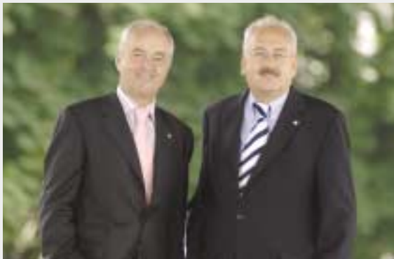
Dir. Werner Scherde