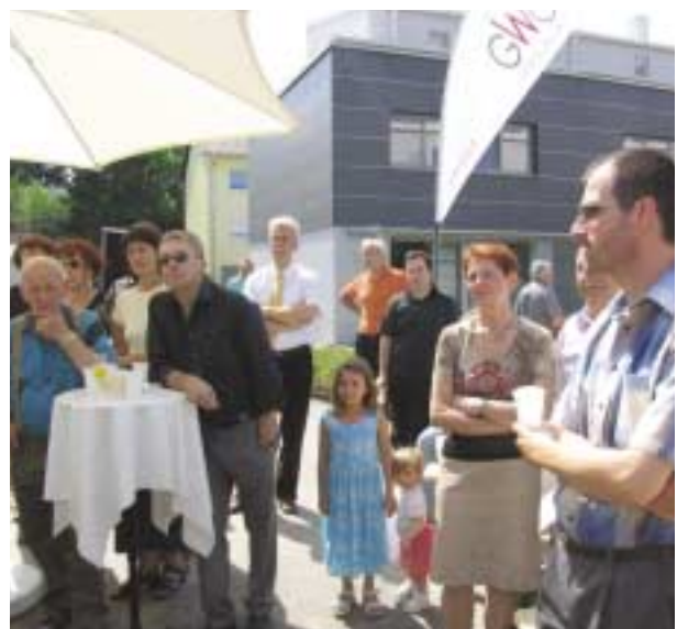
Die Eigentümer feiern den Einzug in die Reihenhäuser Schlantendorf