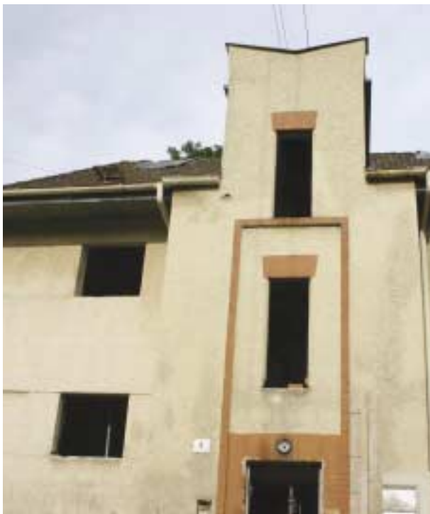
Revitalisierung des Altbestandes: nur die Gebäudeaußenhülle bleibt bestehen