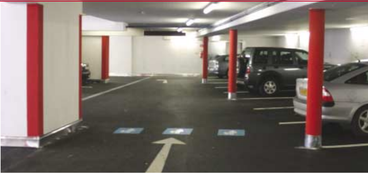
Bewohnergarage Fabrikstraße 1, 1a-d