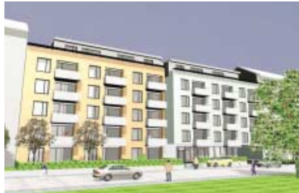
Betreubare Wohnungen Hochwangerstraße