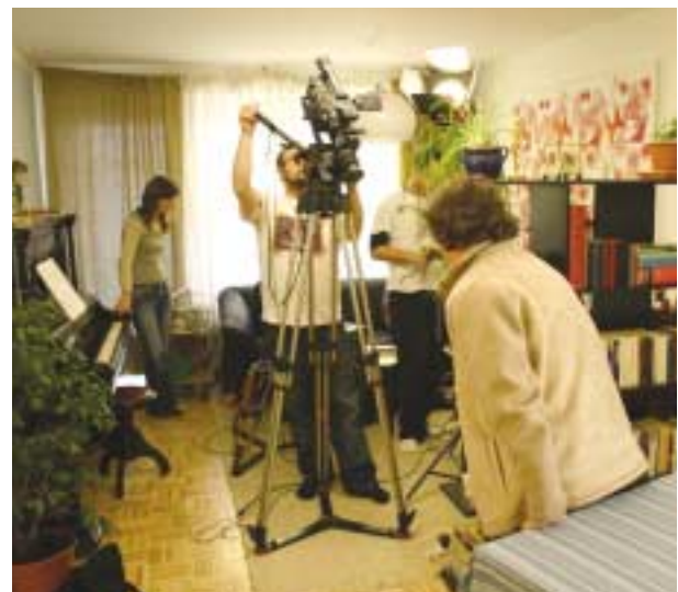
„ACTION“ Team bei den Dreharbeiten.

Eine Frau lebt alleine in ihrer Wohnung. Einmal lässt sie die Türe offen stehen. Ein Mann, der zufällig diese Nacht im Stiegenhaus verbracht hat, nutzt die Gelegenheit und schleicht sich hinein. Die Frau bemerkt ihn nicht, er findet einen Zweitschlüssel und kehrt immer wieder zurück.