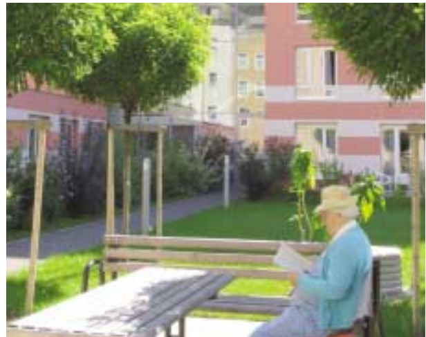
Bethlehemstraße 33 und 33a

Schon bei der Auswahl der Grundstücke berücksichtigt die GWG die spätere Nutzung. Bevorzugt werden Lagen mit hohem Grünanteil, die mit öffentlichen Verkehrsmitteln gut erreichbar