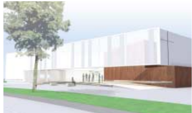
Seelsorgezentrum „Elia“ außen...