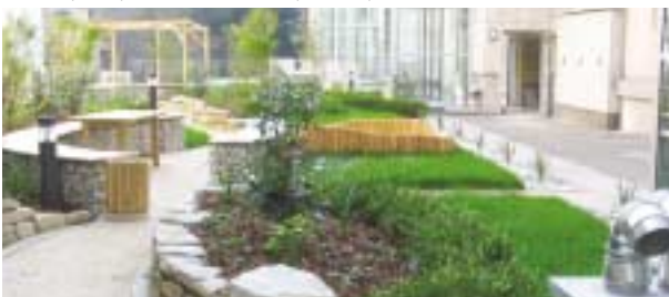
Begrünte Garagendecke Fabrikstraße